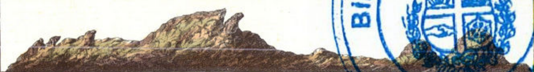
Aldus vertoont CURACAO als men uyt den Oosten komt, en als 't 3. Mylen West van u is.

Nee Sigh 't Eyland CURACAO uyt der Zee vertoont. Liggende tusfen de 12 en 16 Graaden N. en de 60 Graaden W. en de 10 Graaden N. en de 60 Graaden W.